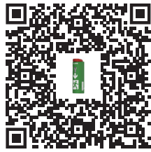
Montageanleitungen für den AlertLatch Türwächter